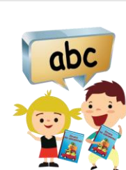
Nous lisons avec expression.