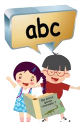
Nous lisons ensemble.