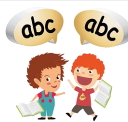
Je lis et tu relis après moi.