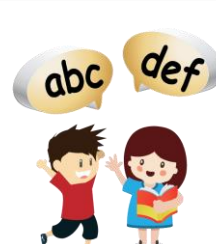
Je lis une phrase, tu lis la prochaine.